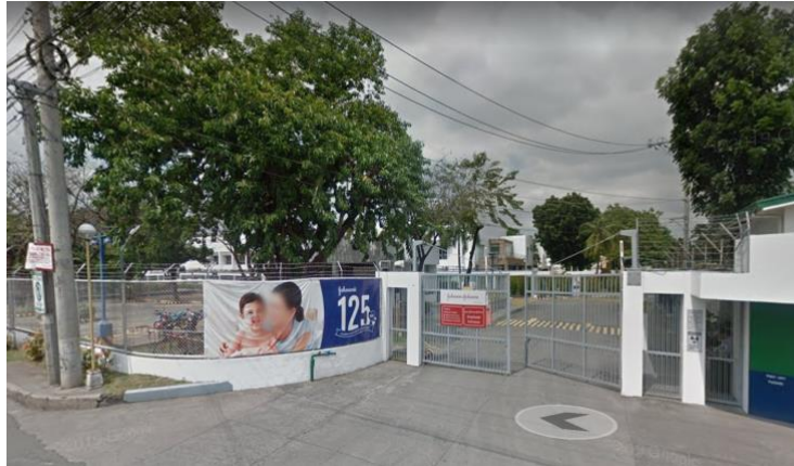
Entrada de la planta de talco para bebés de J&J, Parañaque City, Filipinas. Vista de Google Maps Streetview.

J&J continúa vendiendo talco para bebés en el país. 21 Según una declaración de la empresa del 19 de mayo de 2020, "El talco para bebés de Johnson's se ha convertido en parte de la rutina de cuidado personal de la familia filipina por más de 60 años. Johnson & Johnson sigue confiando incondicionalmente en la seguridad de su talco para bebés Johnson's". 22