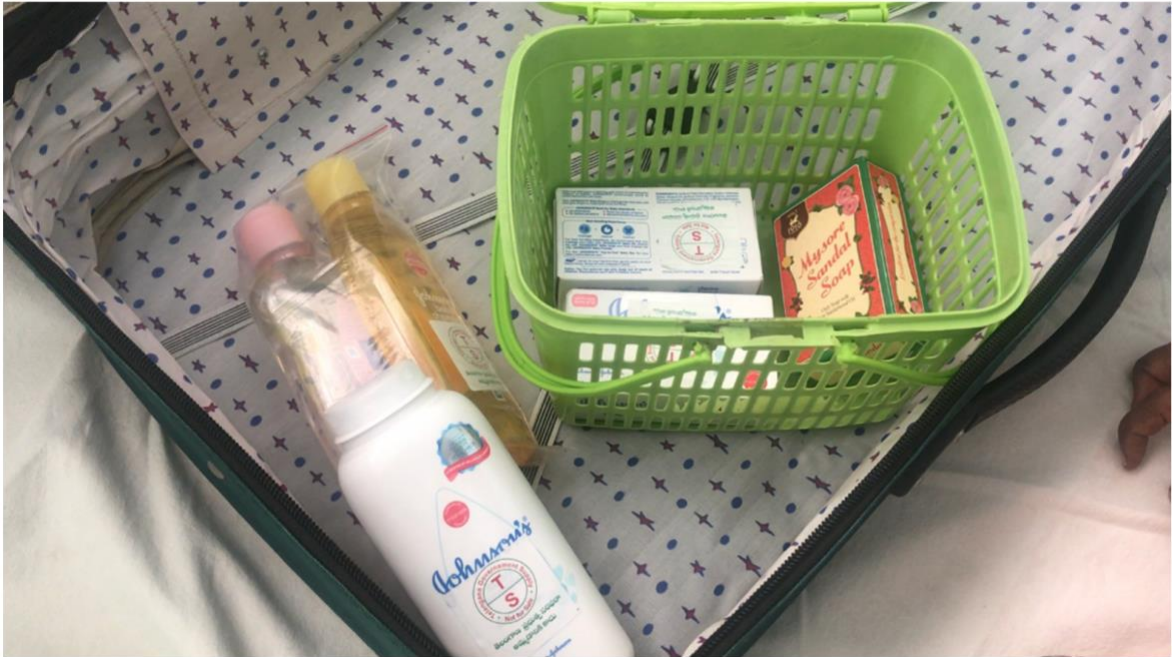
KCR Kit is inspired by the success of the Amma Baby Care Kit Scheme